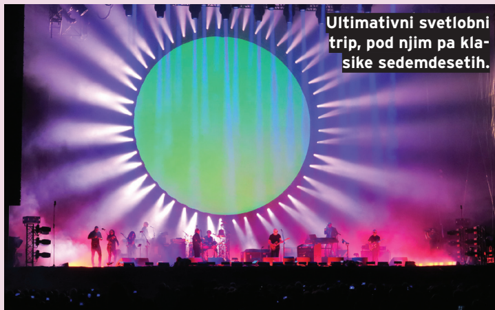
Ultimativni svetlobni trip, pod njim pa klasične sedemdesetih.