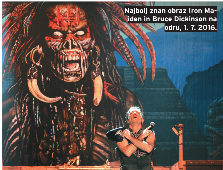
Najbolj znan obraz Iron Maiden in Bruce Dickinson na odru, 1. 7. 2016.

Naslednji, do večera še vedno soparni dan so glavni fokus predstav-