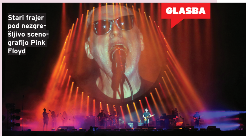
Stari frajer pod nezgrehljivo scenografijo Pink Floyd